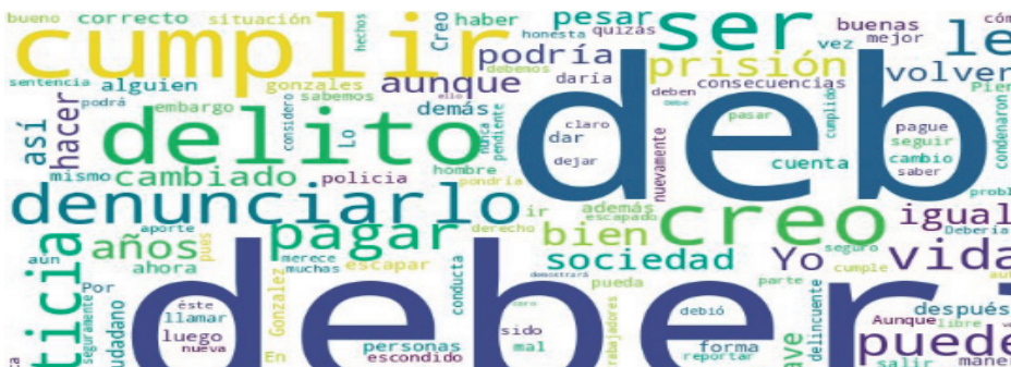
Nube de palabras 2: Sí denuncia

Dentro del total de respuestas, 72 sujetos (solamente un 19,6% del total) usaron expresiones condicionales que serán analizadas en este trabajo. No se encontraron diferencias entre los distintos descriptores como edad, género, educación y lugar de procedencia. Esto quiere decir que la muestra es homogénea en sus respuestas en relación con la decisión tomada, denuncia o no, y también al momento de usar expresiones condicionales. No hay diferencias significativas en relación con las variables independientes. En el siguiente gráfico se ejemplifica el uso de condicionales en relación con la nacionalidad donde notoriamente no hay diferencia en su uso: