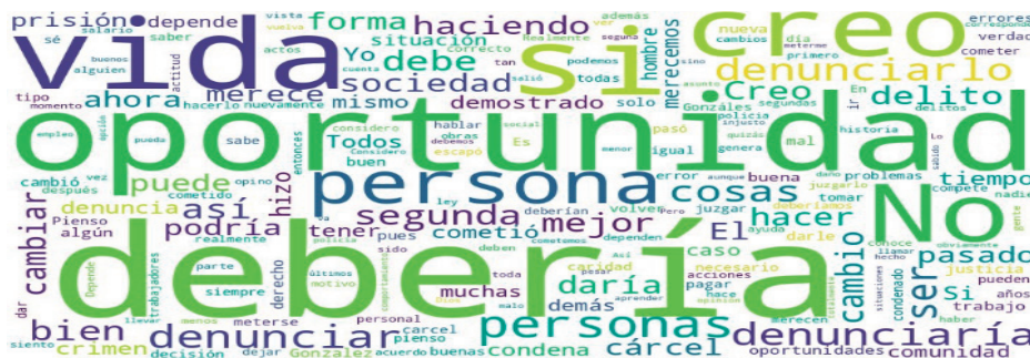
Nube de palabras 1: No denuncia

En relación con un análisis semántico vía nube de palabras, que nos permite identificar aquellos elementos que continuamente aparecen en las expresiones condicionales, que aparecen luego en las ideas fuerza de los condicionales usados, se pudo constatar inicialmente lo siguiente: